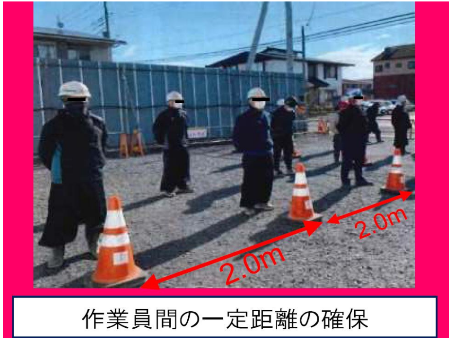
作業員間の一定距離の確保