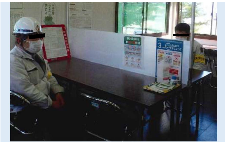
パーティションで密接を防止